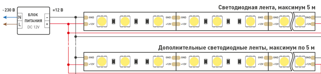
Схема 2. Подключение нескольких светодиодных лент с двух сторон. Рекомендуется использовать для обеспечения равномерного свечения ленты по всей длине.